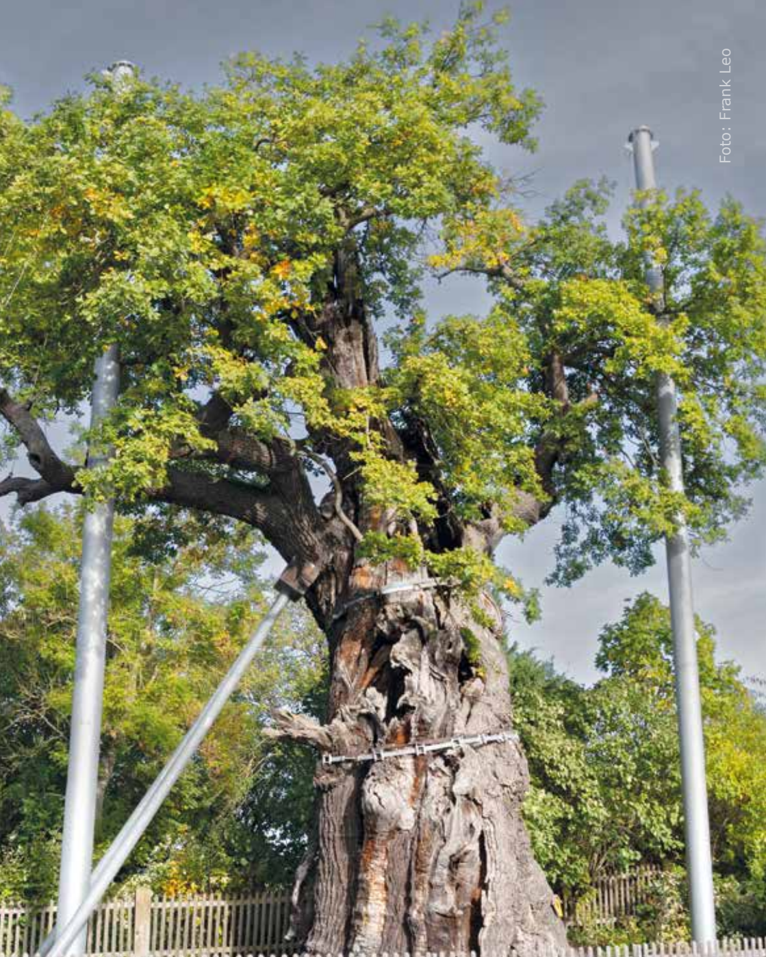
Die 1000-jährige Eiche in Nöbdenitz. Seit vielen Jahren hat der Baum ein Stützsystem, damit er nicht auseinanderbricht.