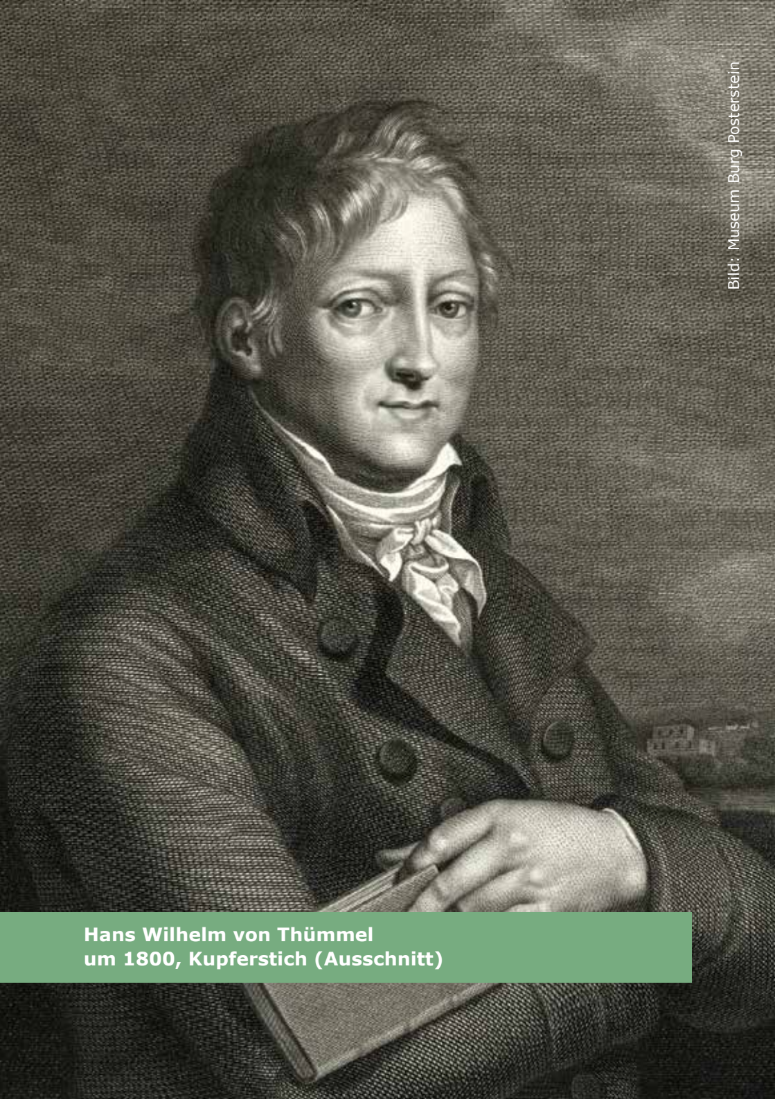
Hans Wilhelm von Thümmel um 1800, Kupferstich (Ausschnitt)